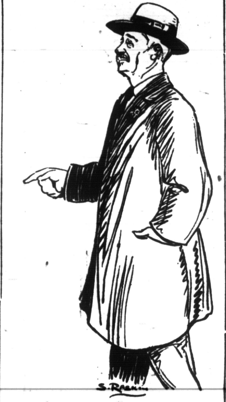
די מיידלאך רופען איהם "דער". ריכמיגער נשמען איז ווייגער. איז אימער אויף דער פיקעם ליין מומ שלעם וושם מען דשרף.

רען גאסט, קאָנגרעסמען פאיר לאָנדאָן. ער האָט נערעדט 11 א זייגער אין דער פריה אין - מאָמאַשעווסקי'ם ניישיאָנאַל מעאַ־ טער פאר די ווייטגודם סטרייקער און אביסעל שפעטער אין די האלס פון די ווייסט אוז דרעס סטרייקער. ער האט געד